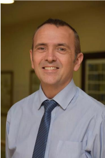
Pennaeth Gwasanaeth Tai