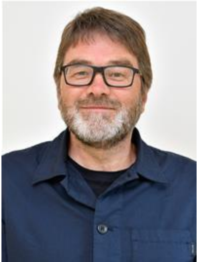
Deilydd Portffolio Tai